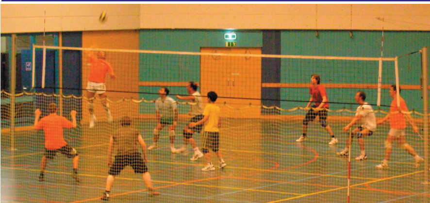
René slaat de bal op rechtsvoor. De middenman springt bijzonder hoog en scoort ook deze bal tijdens de training van Heren 1 en 2.